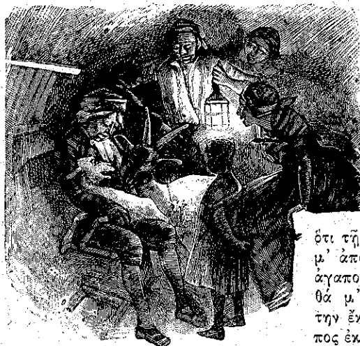
Ὅλοι αὐτοὶ μ' ἐκτύπαιαν μ' ἔκφρασιν συμπαθείας. (Σελ. 102, στήλ. α')

«Ἀπεκομήθη καὶ εἶδα εἰς τὸν ὕπνον μου, ὅτι ἔξαναγύρισεν ἐκεῖνος ὁ ἄνθρωπος καὶ ἔλεγε εἰς τὴν κυρίαν Μίλχ: «Θέλω τὴν γίδα σου! τὴν θέλω! Τὴν χρειάζομαι καὶ θὰ τὴν πάρω». Ἐξάφνα ἐξύπνησα. Δὲν ἤμουν πλέον εἰς τὸ κρεβάτι μου. Μετ' εἶχαν σκεπασμένη μ' ἕνα ρούχον, τὸ ὅποιον δὲν με ἄφινε νὰ