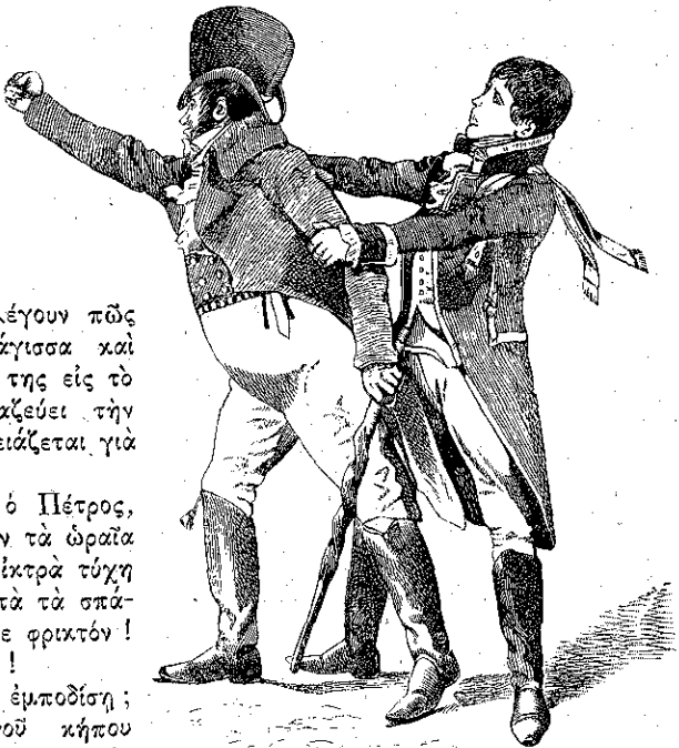
«Ὁ Δαγκέν ἐξηκολούθει νὰ σείῃ τὸν γρόνθον του». (Σελ. 98, στήλ. 6').

Τὴν ἐπαύριον, κατὰ τὰς δύο, ὁ Πέτρος ἐξῆλθε, χωρὶς νὰ εἶπῃ εἰς τὴν μητέρα του ποῦ πηγαίνει· ἡ συνειδησίς του δὲν ἦτο ἐντελὴς ἤσυχος. Ἡ μητέρα του ἐν τούτοις τῷ ἐπέτρεπε τὰς ἀγροτικὰς αὐτὰς ἐκδρομὰς μαζί μετὰ τὸν ἐξαδελφόν του, ὁ ὁποῖος ἦτο μεγαλύτερός του κατὰ δύο ἔτη· ὁ Πέτρος ἦτο μόλις δεκαετής, ἀλλ' ἦτο πολὺ φρόνιμος καὶ πολὺ εὐπειθής. Εἶχεν ἀγαθὴν καρδίαν καὶ δέν ἤθελε νὰ λυπῇ κανένα. Διὰ τοῦτο προσεπάθει νὰ πείσῃ τὸν ἑαυτόν του, ὅτι ἡ πράξις τὴν ὁποίαν ἠτοιμάζετο νὰ κάμῃ ἦτο καλὴ, ὡς σωτηρία τῶν ὠραίων ἐκείνων ἀνθῶν ἀπὸ τὰ σκληρὰ χέρια τῆς γρηᾶς. Ὅλην τὴν νύκτα τὰ ἔβλεπεν εἰς τὸν ὕπνον του, ὠραῖα, δρο-