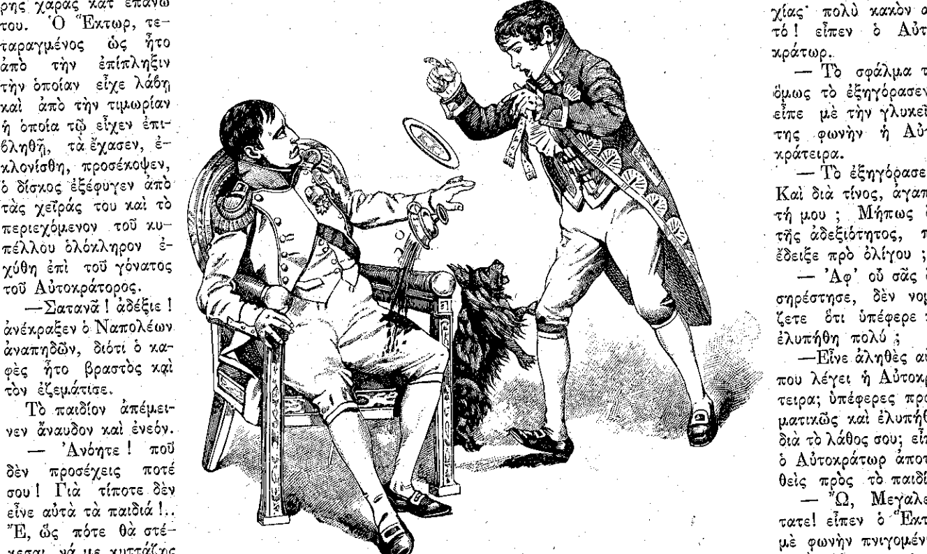
Τό περιεχόμενον τού κυπέλλου όλόκληρον έχύθη επί τού γόνατος τού Αυτοκράτορος. (Σελ. 97, στήλ. α').

Όπωςδήποτε, χωρίς λέξιν, έλαβε τόν δίσκον, και διά ναναικτήση τόν άπολεσθέντα χρόνον, έτρεξε μετά σπουδής είς τήν αίθουσαν. Άλλ' άκριβώς όταν έφθασε πρós τού Αυτοκράτορος, ο Φρίτσκιν, ο μικρός σκύλος τής Αυτοκρατείας, άναγνώρισας τόν φίλον του, έσχίρτησε και ώρμησε πλήρησ χαράς κατ' επάνω του. Ο Έκτωρ, τεταραχμένος ως ήτο από τήν επίπληξιν τήν όποίαν είχε λάβη και από τήν τιμωρίαν ή όποία τώ είχεν επιβληθή, τά έχασεν, έκλονίσθη, προσέκοψεν, ο δίσκος έξέφυγεν από τάς χείράς του και τό περιεχόμενον τού κυπέλλου όλόκληρον έχύθη επί τού γόνατος τού Αυτοκράτορος. —Σατανά! άδέξιε! άνέκραξεν ο Ναπολέων άναπηδών, διότι ο καφές ήτο βροστός και τόν εξεμάτισε. Τό παιδίον άπέμεινε άναυδον και ένεδν. —Άνόητε! πού δέν προσέχεις ποτέ σου! Για τίποτε δέν είνε αυτά τά παιδιά!.. Έ, ως ποτέ θά στέκεσαι νά με κυττάξης έτσι; Δέν ηγγαίνεϊς τούλάχιστον νά φέρης μια πετοέτα νά σκουπισθώ; Ο Έκτωρ έτρεξε παραχαλισμένος και έπέστρεφεν είς τήν στιγμήν με τό ζητηθέν μακτρον. Ήρχισε δέ νά τρίβη δυνατά τό γόνατον τού Ναπολέοντος, τό όποιον άλλως τε ή Αυτοκράτειρα είχεν ήδη σπογγίση με τό μανδύλιόν της. —Πού είνε τό φλυτζάνι; ήρώτησεν ο Αυτοκράτωρ. —Ίδού, Μεγαλειότατε! είπεν ο Έκτωρ άνεγείρων τό κύπελλον και παρουσιάζων αυτό μετά προθυμίας και χάριτος, ώσει θέλων νά συγκαλύψη τήν πρώτην του άδεξιότητα. —Α, δέν έπαθε τίποτε, είπεν ο Αυτοκράτωρ λαβών και παρατηρήσας αυτό. Είσαι εύτυχής διότι άν έσπαζε, θά σ' έθετα υπό κράτησιν άβριον όλην τήν ήμέραν.